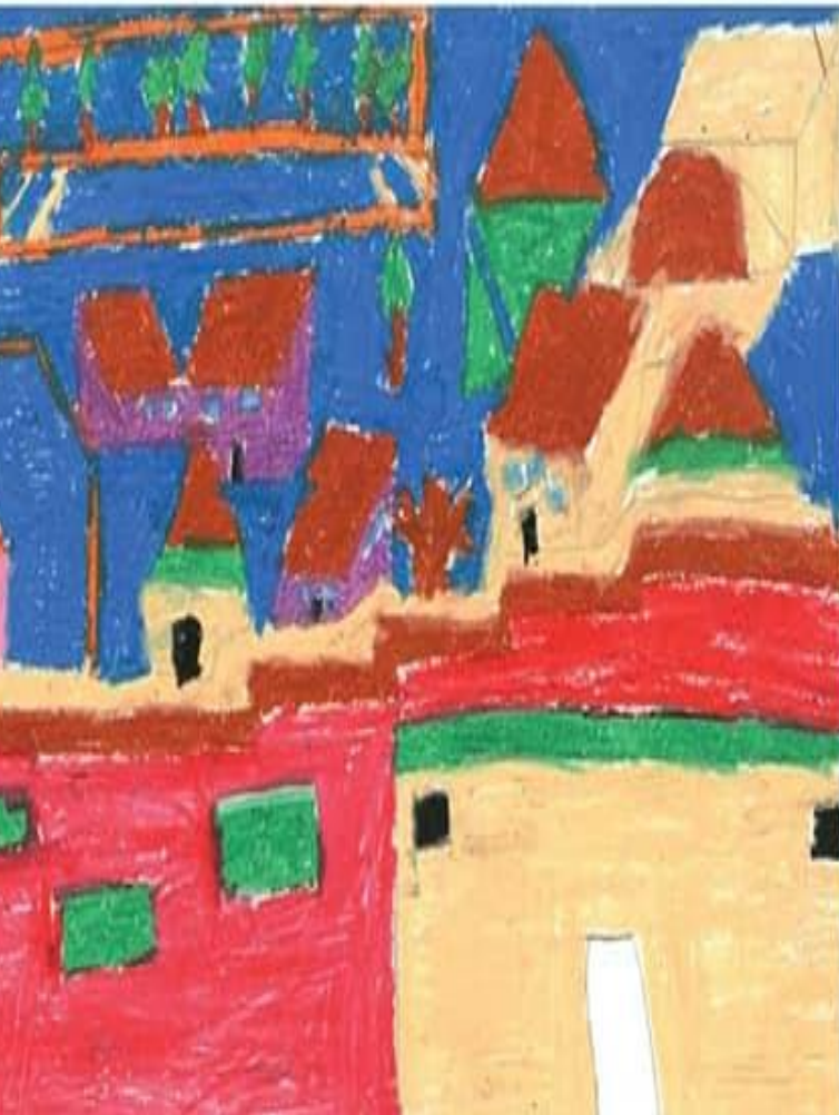
رغد ياسر الشوفي